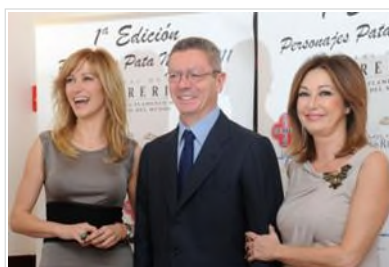
Alberto Ruiz Gallardón, alcalde de Madrid, rodeado por los periodistas Susana Griso y Ana Rosa Quintana.